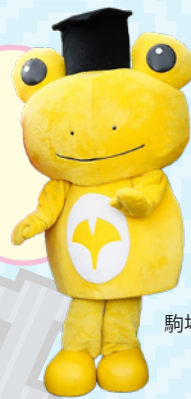
駒場祭委員会マスコット 「こまっけろ」