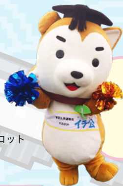
東京大学運動会マスコット 「イチ公」